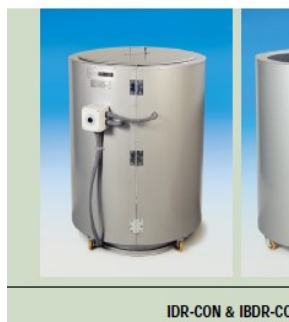
IDR-CON & IBDR-CON