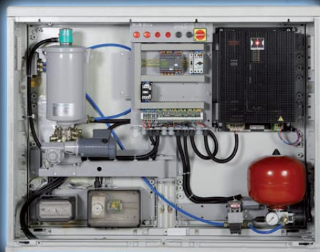
StaTrack со сменным баком